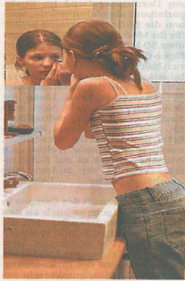
Der Streit um die Zeit im Badgehört zur Pubertät.

Im Rahmen des Kurses „Starke Eltern – starke Kinder“ bietet der Frankfurter Kinderschutzbund auch ein Element „Pubertät“ an. Es richtet sich an Eltern aber auch Großeltern. Nähere Informationen stehen im Internet unter www.kinderschutzbund-frankfurt.de .