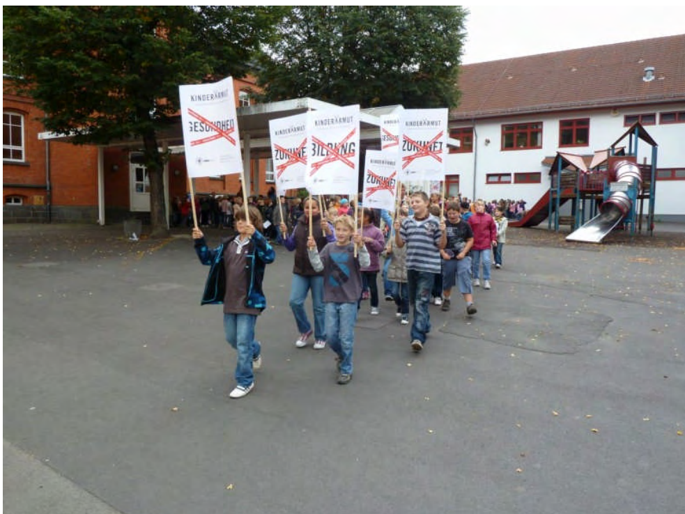
Demo des DKSB OV Schotten zum Weltkindertag 2010 gegen Kinderarmut

Im europäischen Jahr gegen Armut und soziale Ausgrenzung ist die Bekämpfung der Kinderarmut das Schwerpunktthema im Deutschen Kinderschutzbund. Der auffällige Logoschriftzug „ Armutsschere “ auf Absperrbändern machte auf Orte und Bereiche aufmerksam, von denen arme Kinder ausgeschlossen sind.